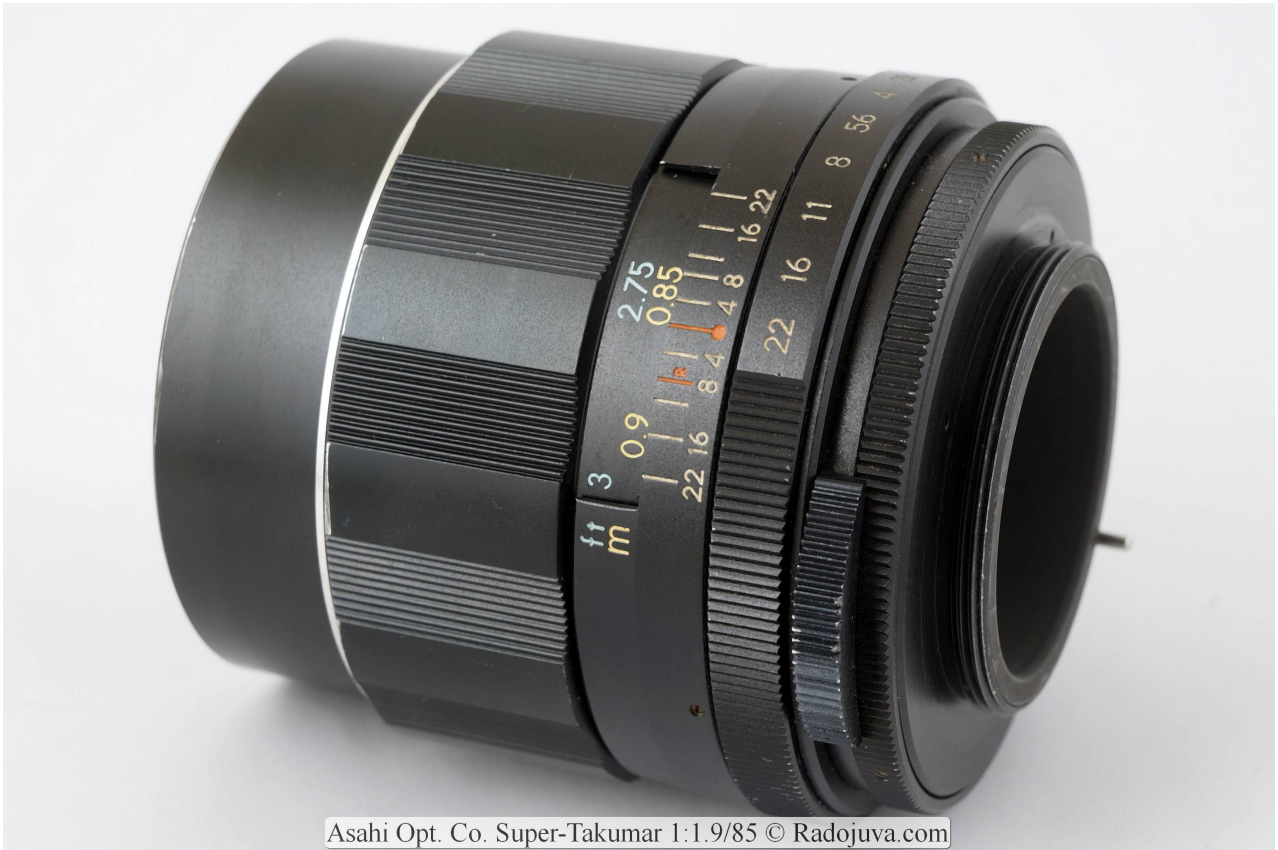
Asahi Opt. Co. Super-Takumar 1:1.9/85