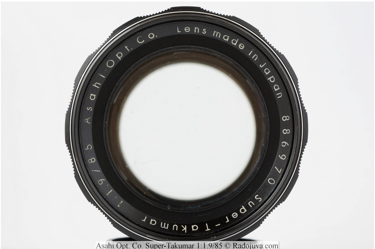
Asahi Opt. Co. Super-Takumar 1:1.9/85

镜头带有 金属遮光罩 ，它被拧入前滤镜的螺纹中。镜头在我出生之前就停产了，但即使在几十年后，它仍然可以继续工作，并且对它的工作感到满意。