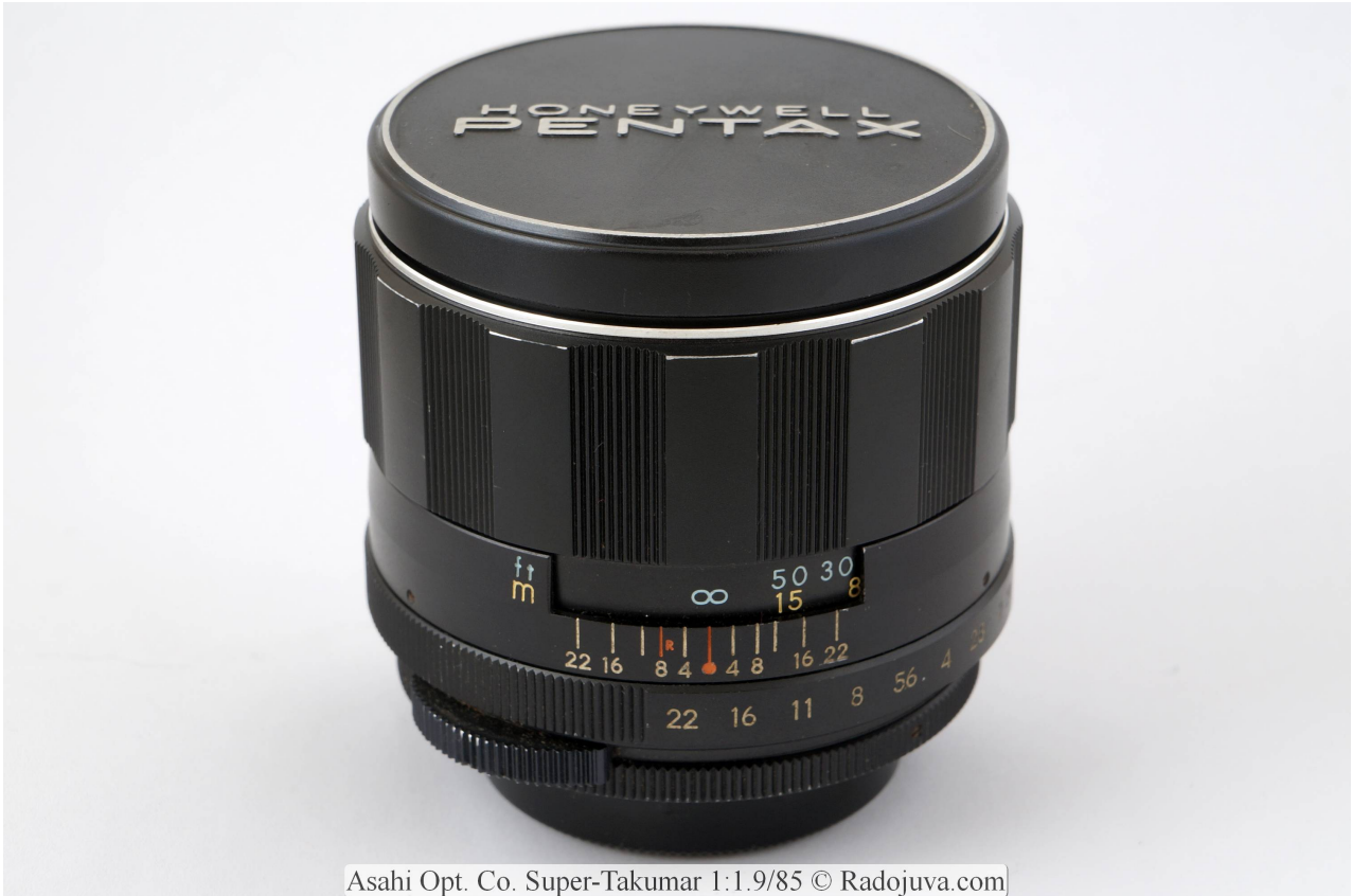
Asahi Opt. Co. Super-Takumar 1:1.9/85

Super-Takumar 1 : 1.9 / 85 – 一种传奇，镜头具有良好的光学性能和良好的“坚不可摧”设计。Super-Takumar 1 : 1.9 / 85 还有两个相似的兄弟，这个 Asahi Opt. Co., Auto-Takumar 1: 1.8 / 85 和 Asahi Opt. Co., Super-Multi-Coated Takumar 1 : 1.8 / 85 及更早版本 Asahi Opt. Co. Super-Takumar 1 : 1.9 / 85 。F / 1.8 F / 1.9之间的光圈差是1.11倍。