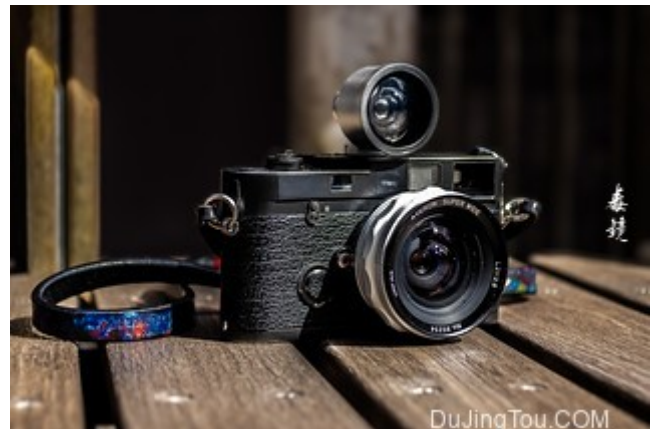
徕卡 M6 上的 Avenon 21mm f2.8 和相关取景器配件

以上资料来自百科 http://camera-wiki.org/wiki/Y.K._Optical