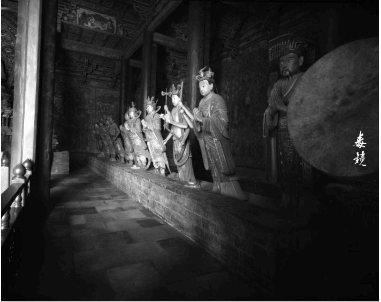
鸿岩：节后大画幅针孔习作—在御河的光影里，遇见时光的呼吸