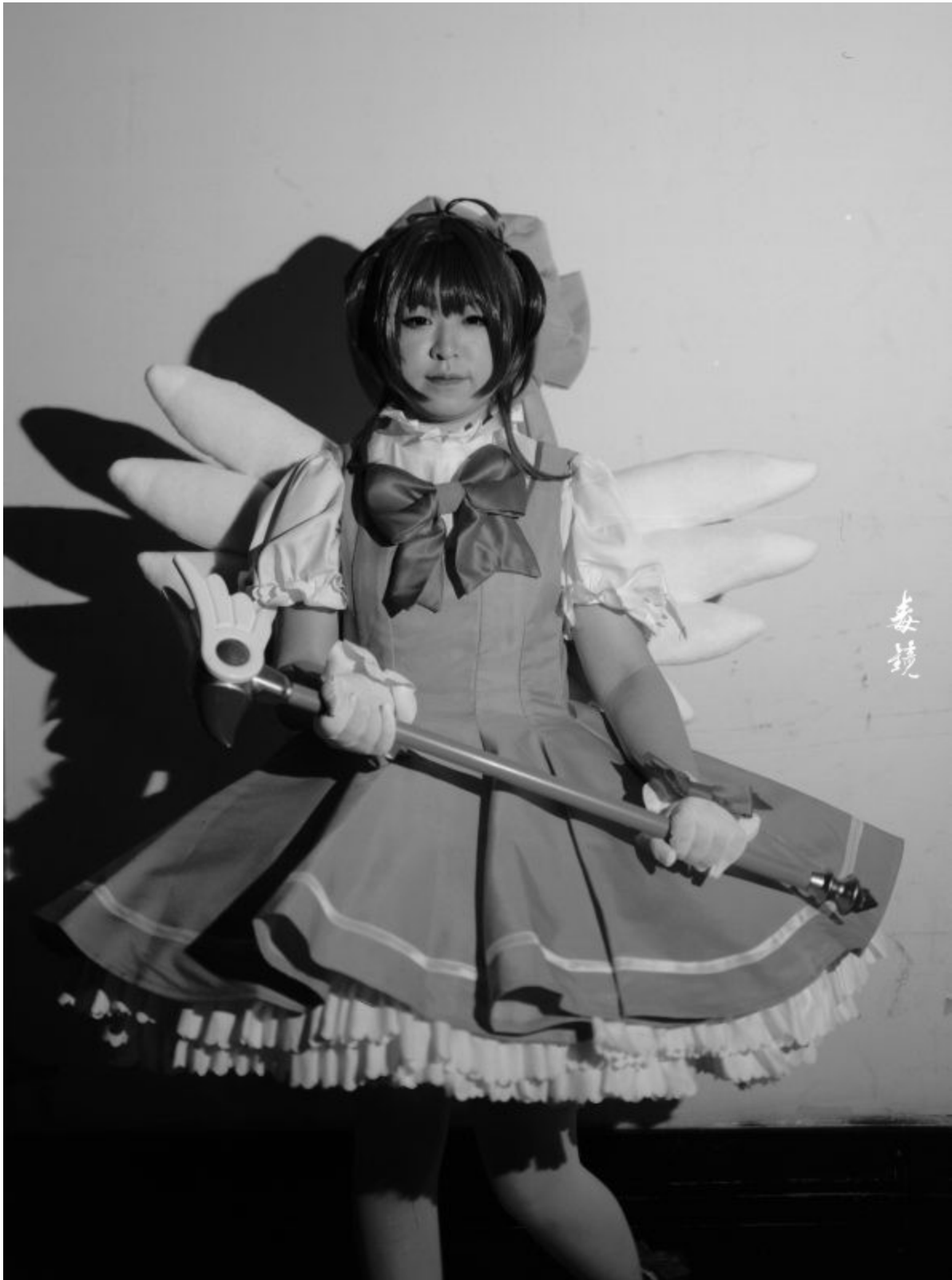
Calumet 150mm f/5.6 Caltar Pro