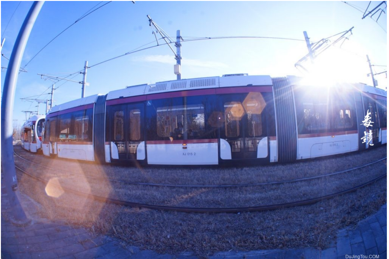
光圈的形状很好看