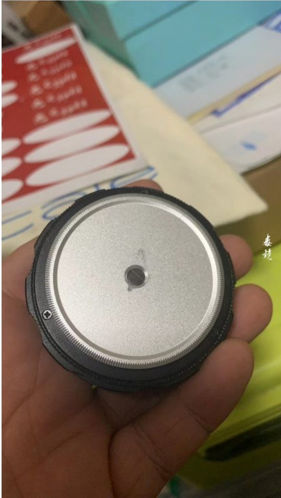
针孔机身盖，M42机身盖加一个转接环即可