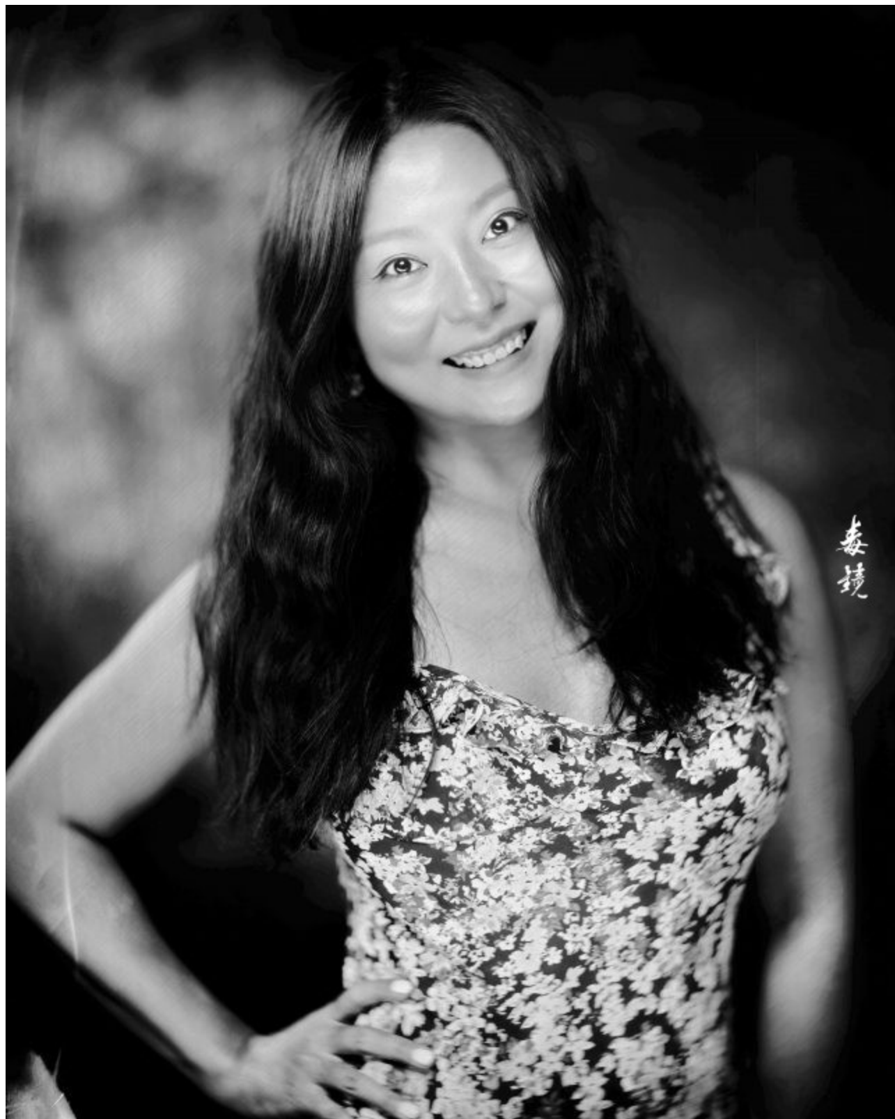
北京田荔 (胶个朋友摄影工作室)