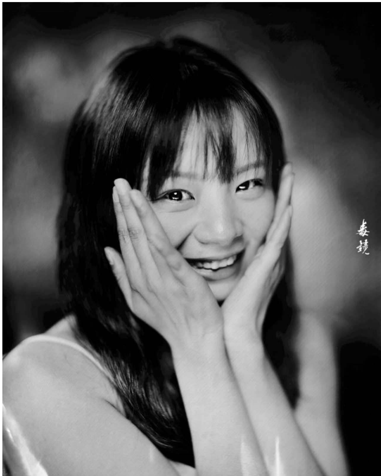
北京田荔（胶个朋友摄影工作室）