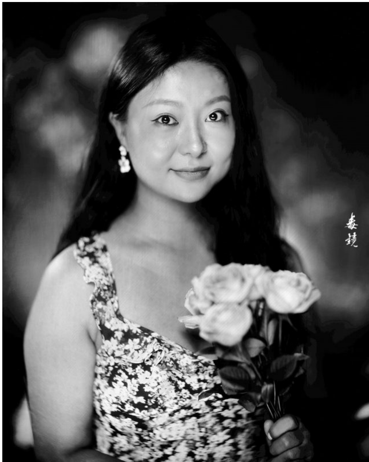
北京田荔