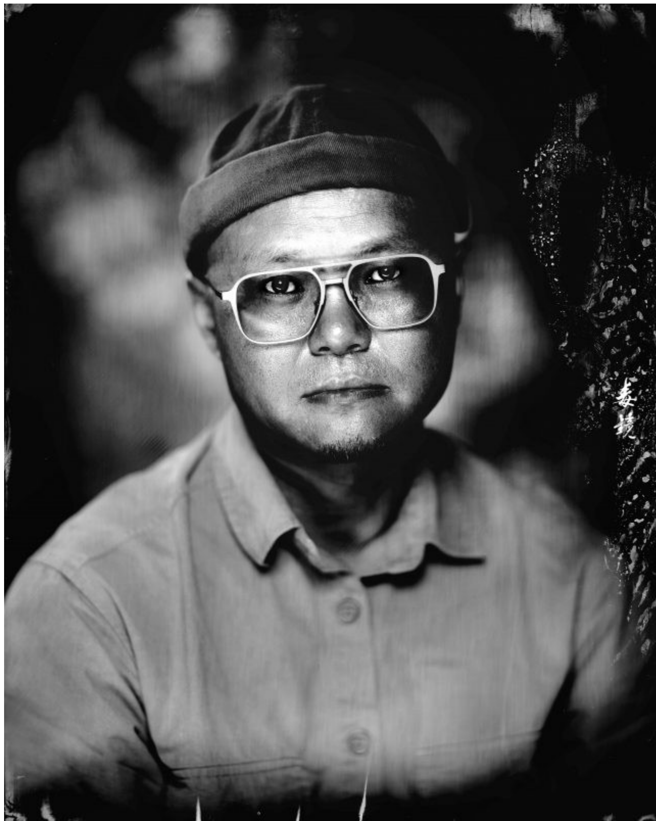
北京田荔（胶个朋友摄影工作室）