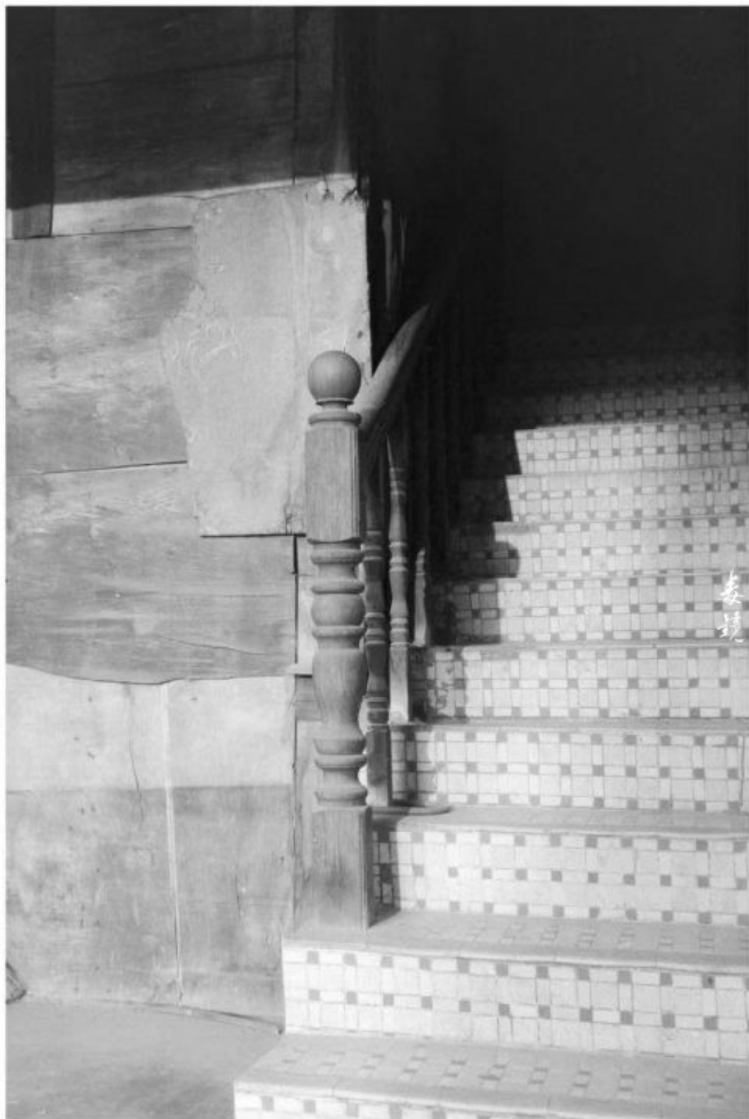
拍摄 光源F5.6 快门1/30s (禄来350) 冲洗 150Pctex显影 24°C/20分钟 地点 广东中山