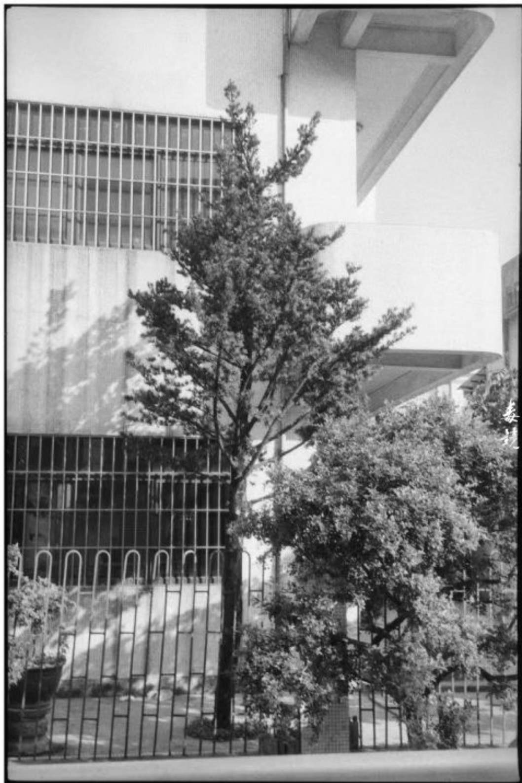
拍摄 光圈F8 快门1/60s (禄来35d) 冲洗 150Pdx显影 24°C/20分钟 地点 广东中山 作者 吴昆志