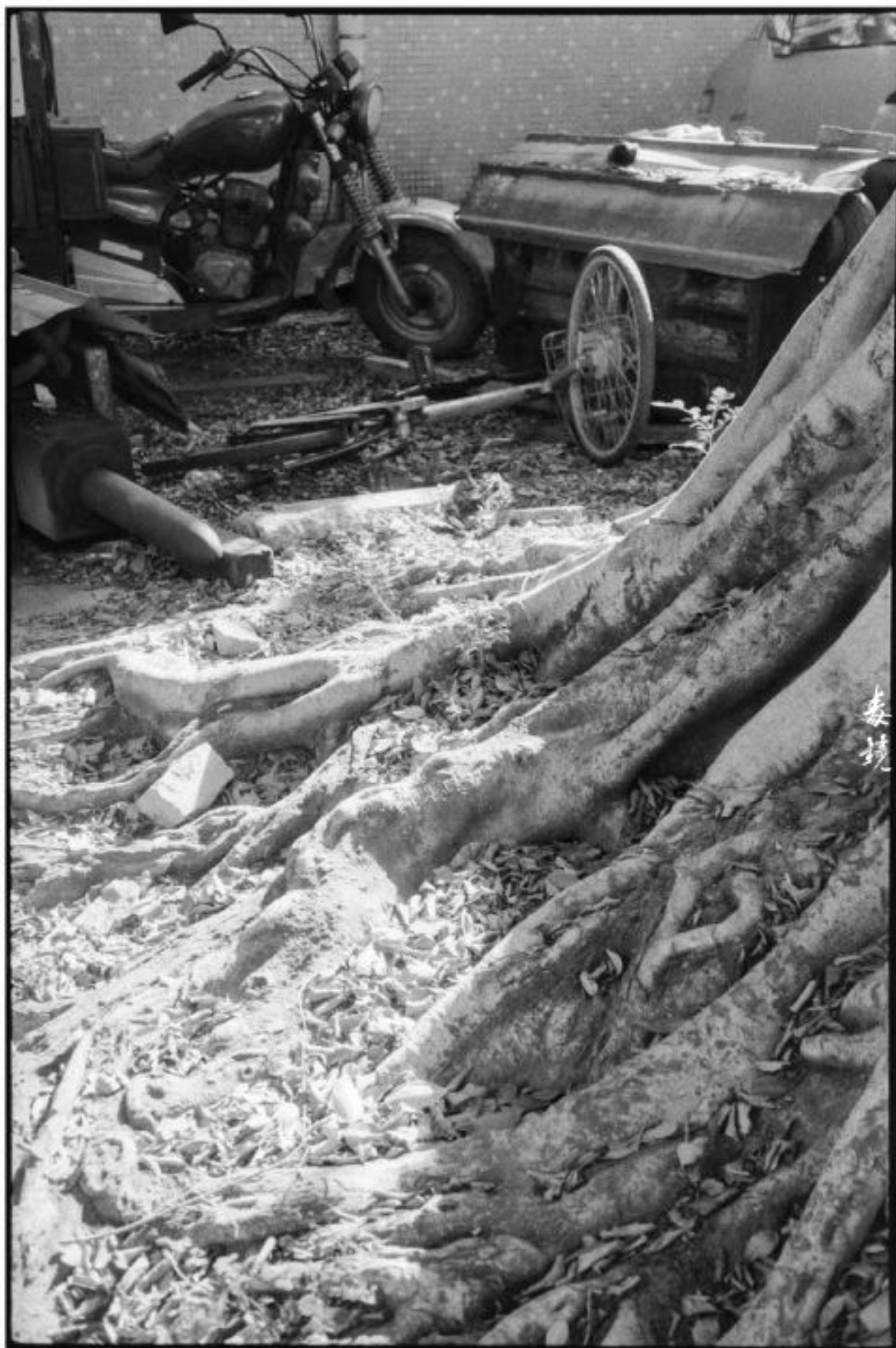
拍摄 光源F16 快门1/30s (曝光35s) 冲洗 1:50 Pcdes显影 24°C/25分钟 地点 广东中山