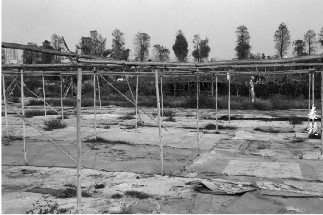
拍摄 光圈F8 快门1/60s (禄来35s) 冲洗 1:50 Picta显影 24°C/20分钟 地点 广东中山

使用 Rollei 35s 胶片相机和 1023 风华胶卷盘片在广东中山进行黑白胶片摄影是一次令人难忘的体验。这款经典相机的小巧设计让我可以轻松携带它，随时随地捕捉瞬间。而选择黑白胶片则为我带来了一种独特的拍摄感受。