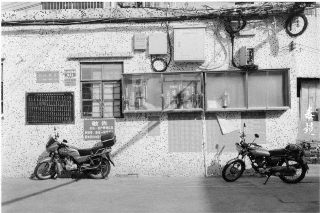
拍攝 光圈F8 快门1/25s (慢速35s) 沖洗 L50 Pctea 显影 24°C/20分钟 地点 广东中山 作者 姜鏡志