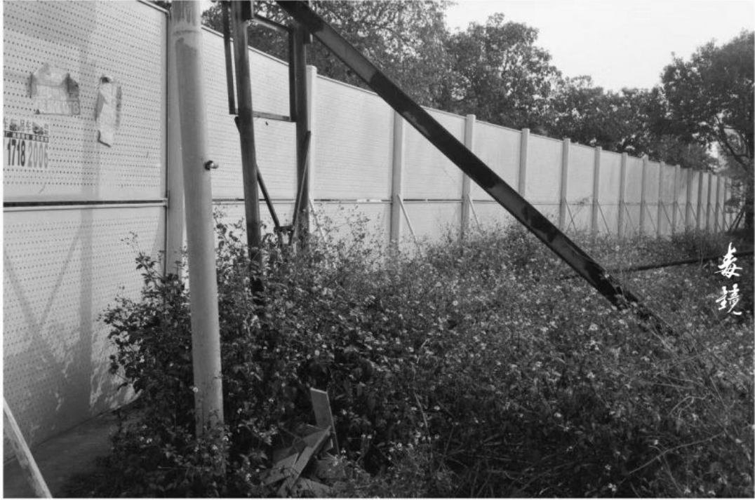
拍攝 光圈F11 快門1/30s (探測器) 沖洗 1:50 Pictor 顯影 24°C/20分鐘 地點 廣東中山