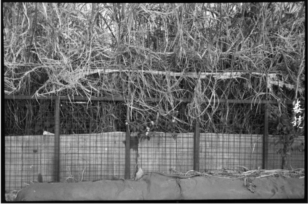
拍摄 光圈F8 快门1/80s (程序35s) 冲洗 1:50 Pctea显影 24°C/20分钟 地点 广东中山