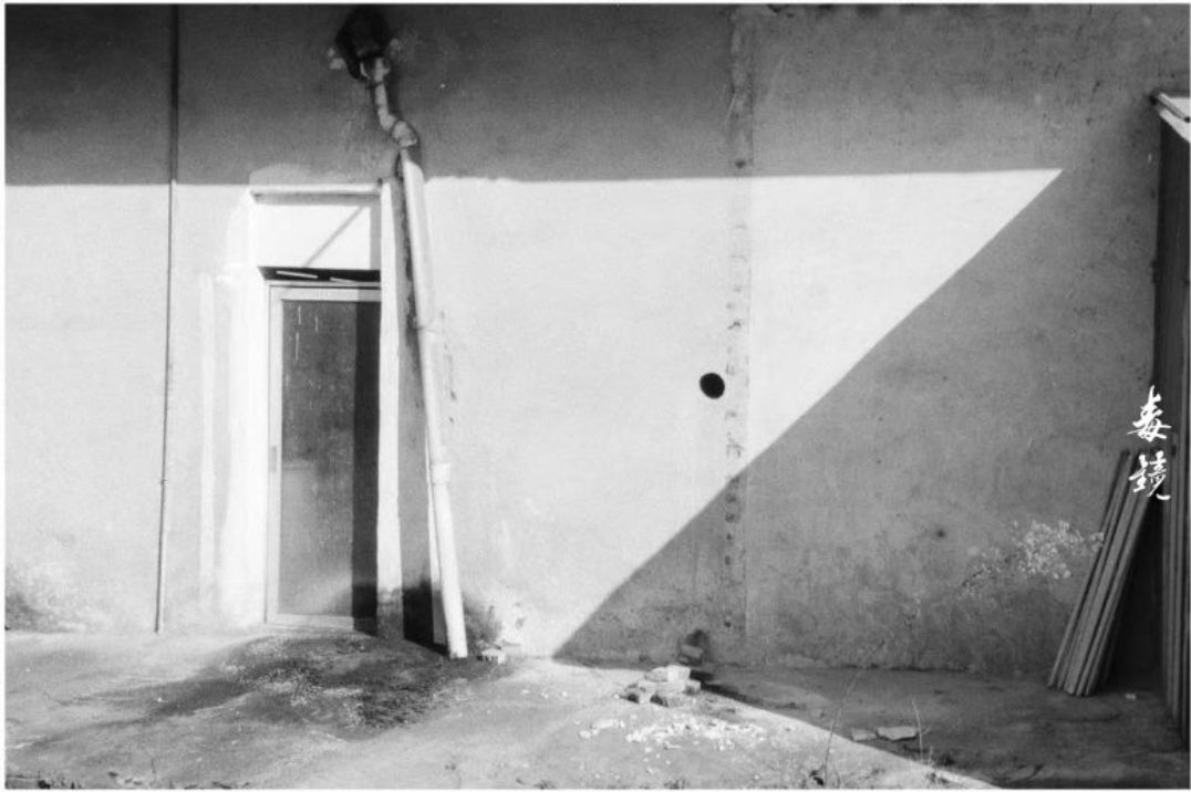
拍攝 光圈F8 快门1/25s (慢速35s) 沖洗 L50 Pctea 显影 24°C/20分钟 地点 广东中山