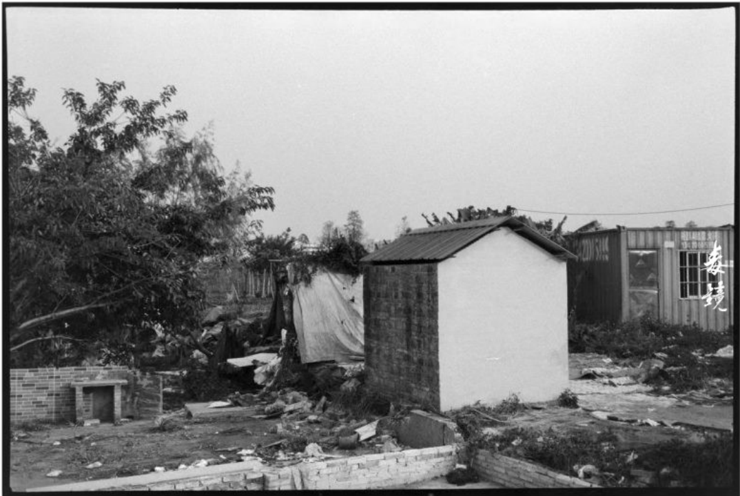
拍攝 光圈F8 快門1/30s (慢來35s) 沖洗 1:50 Pctoo 顯影 24°C/20分鐘 地點 廣東中山 作者 吳龍志