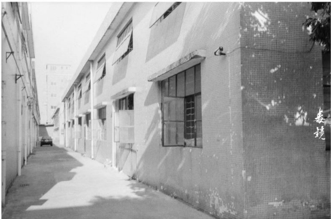
拍攝 光圈F2.8 快門1/250s (綠光35s) 沖洗 1:50 Pctee 显影 24°C/20分钟 地点 广东中山