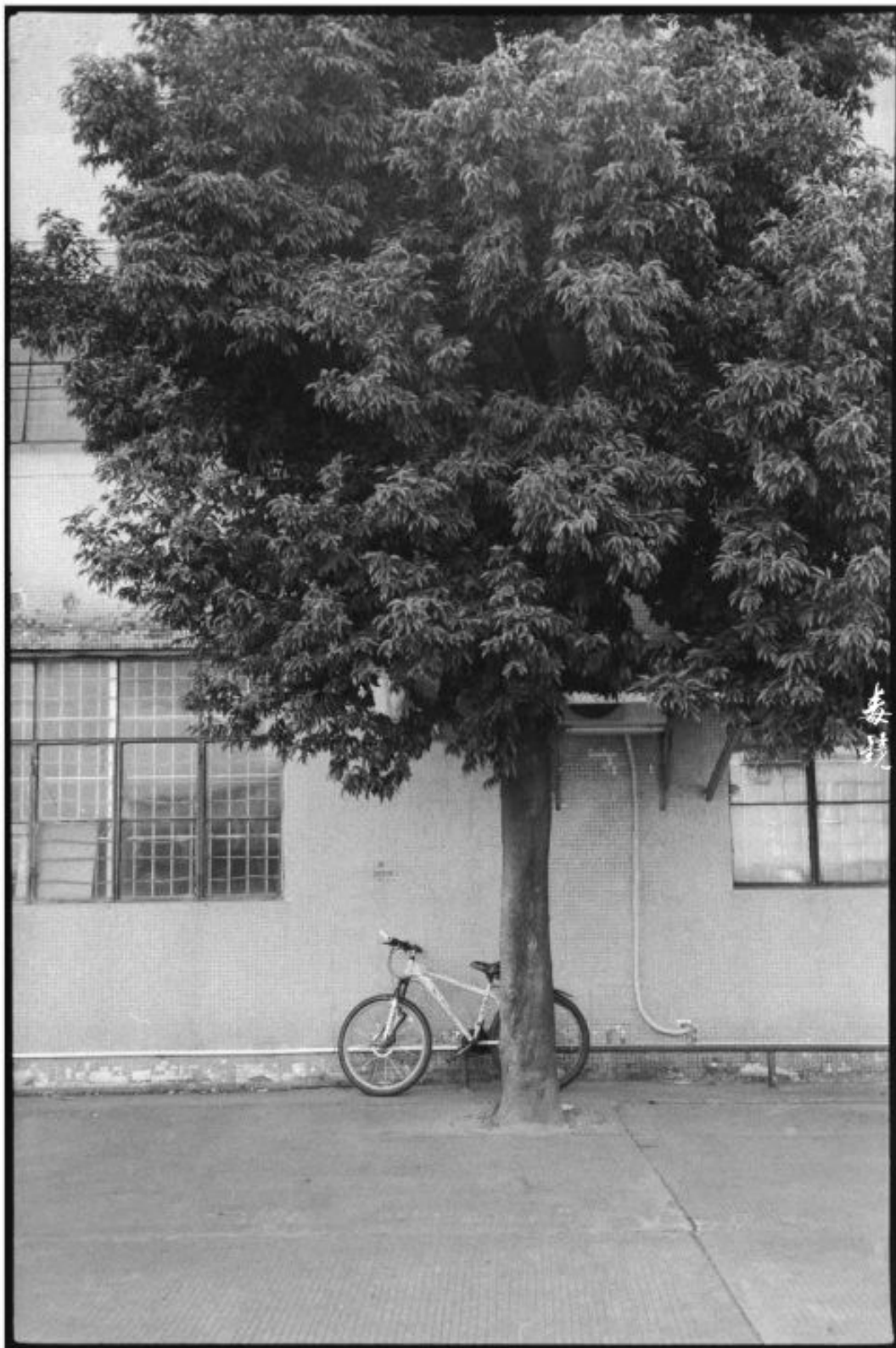
拍摄 光源F8 快门1/60s (曝光35s) 冲洗 L50 Pdx显影 24°C/20分钟 地点 广东中山