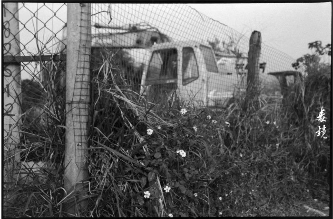
拍攝 光圈F2.8 快門1/250s 感率35d 沖洗 1:50 Fcolor 顯影 24°C/20分鐘 地點 廣東中山 作者 吳昆港