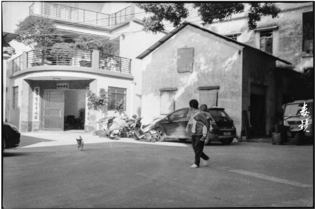
拍摄 光圈F8 快门1/250s 1段米356 冲洗 1:50 Fcotee豆粉 24°C/20分钟 地点 广东中山