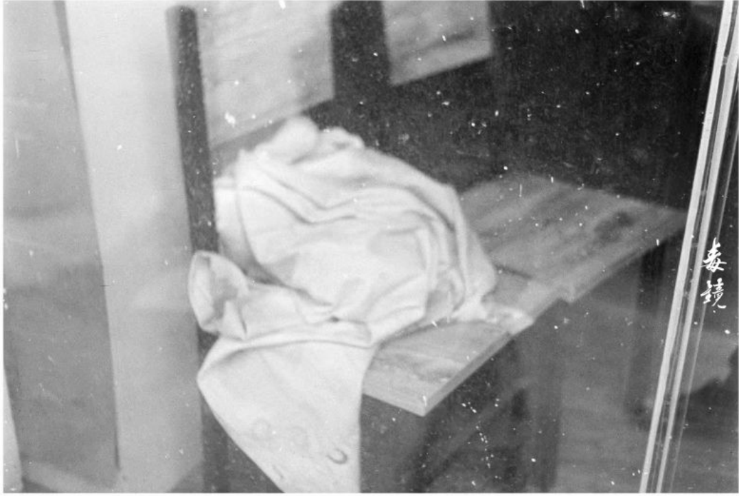
拍攝 光圈F2.8 快門1/125s (感來35s) 沖洗 1:50 Picta 35 24°C/20分鐘 地點 廣東中山 作者 梁耀基