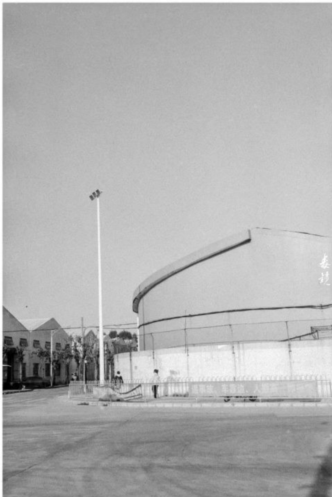
拍攝 光圈F11 快门1/30s (得來35s) 沖洗 1:50 Pds+显影 24°C/20分钟 地点 广东中山