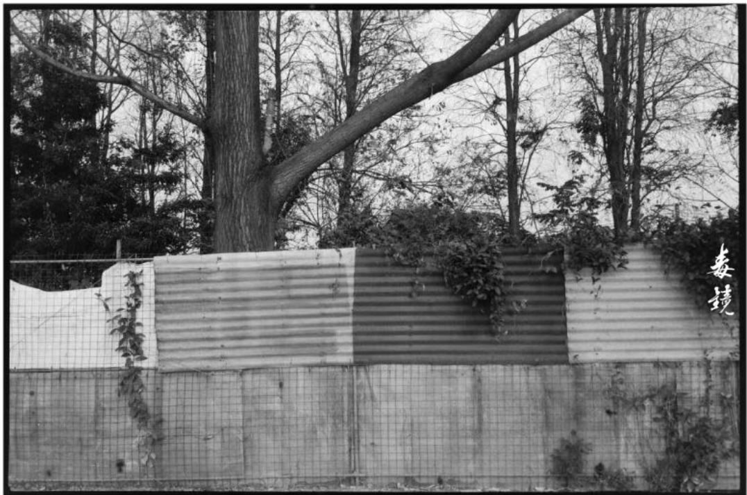
拍攝 光圈F8 快門1/60s (綠半35s) 沖洗 1:50 Picta 顯影 24°C/20分鐘 地點 廣東中山