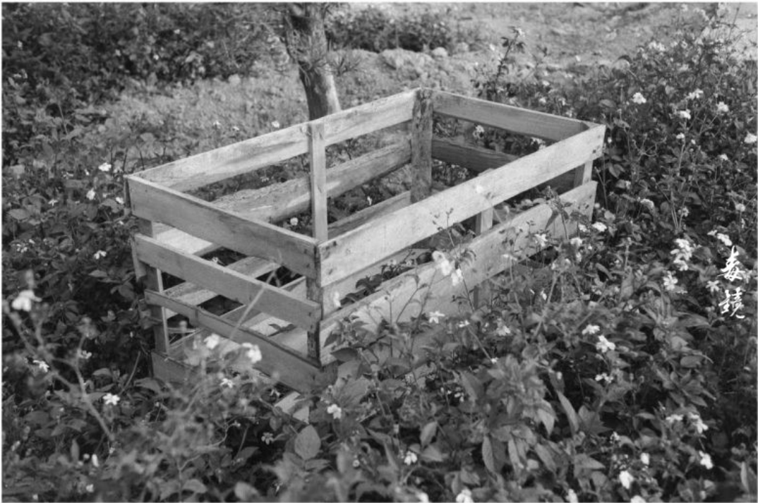
拍摄 光圈F5.6 快门1/125s (程序35s) 冲洗 1:50 Pctea显影 24°C/20分钟 地点 广东中山