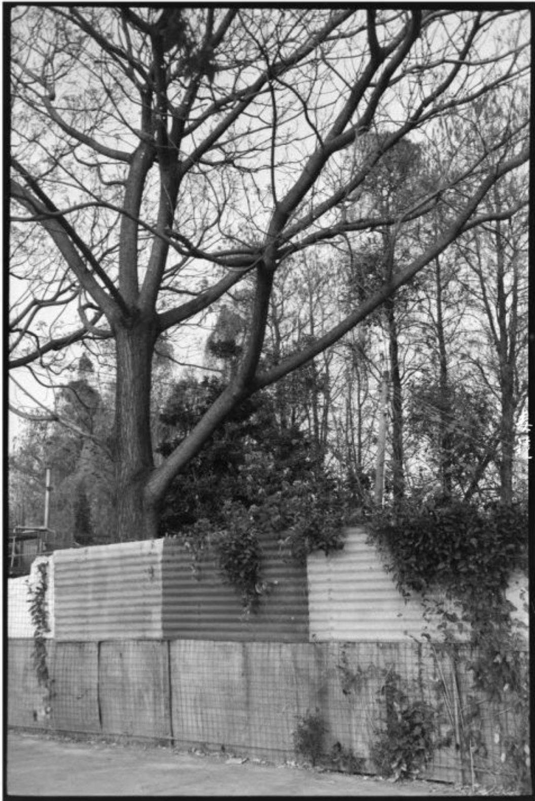
拍摄 光源F8 快门11/60s (禄来35s) 冲洗 1:50 Picta显影 24°C/20分钟 地点 广东中山