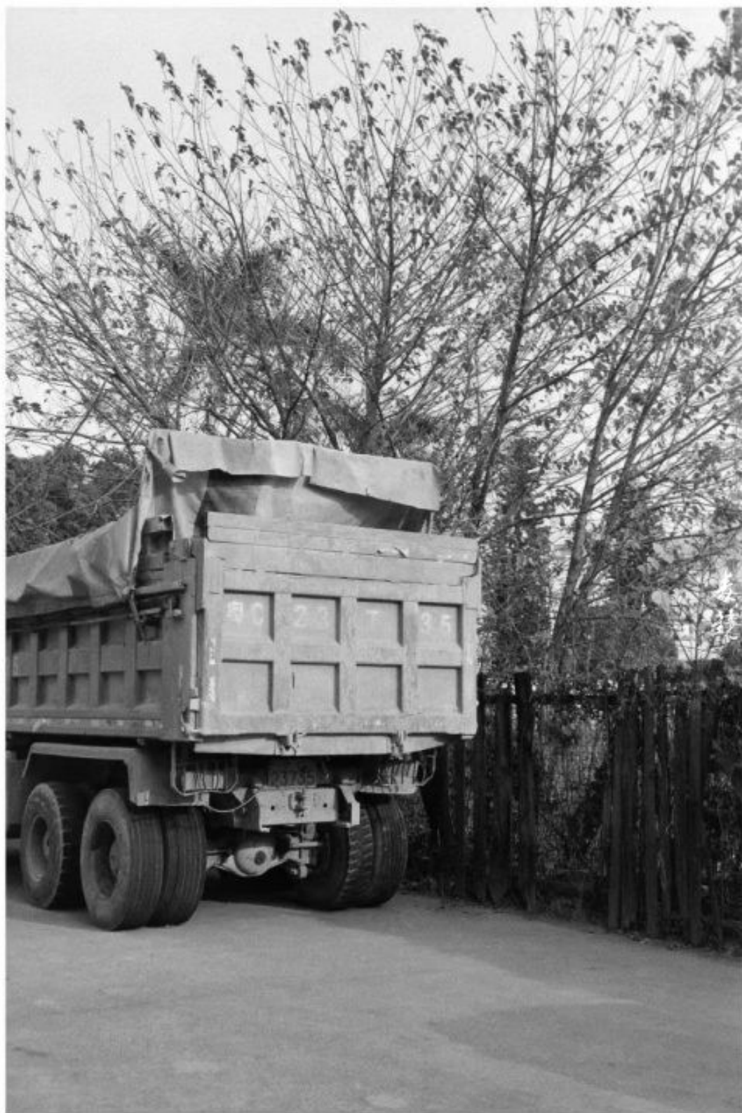
拍摄 光源自然 快门1/60s (禄来35s) 冲洗 1:50 Pdx显影 24°C/20分钟 地点 广东中山 作者 吴建志