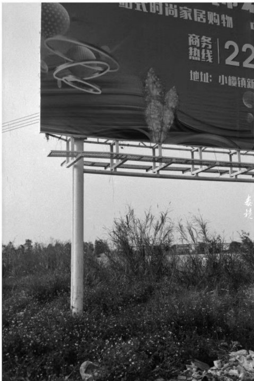
拍摄 光源F8 快门1/60s (曝光35s) 冲洗 1:50 Pdx显影 24°C/25分钟 地点 广东中山