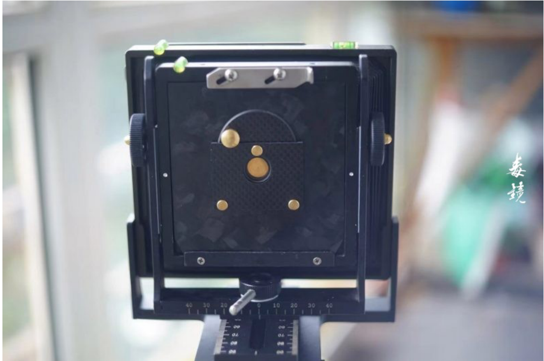
光之印相大画幅针孔摄影快门外观图

一个好的针孔镜头可以用刚柔并济来形容，可以通过增加成像面积和更高精工艺的针孔镜头来改善针孔成像模糊的缺点，针孔摄影是一个简单但是却非常有魅力的实验摄影方式，而且具有均等的景深，整体的柔焦效果带有一种新印象派的特点，无形中具有了艺术特征。