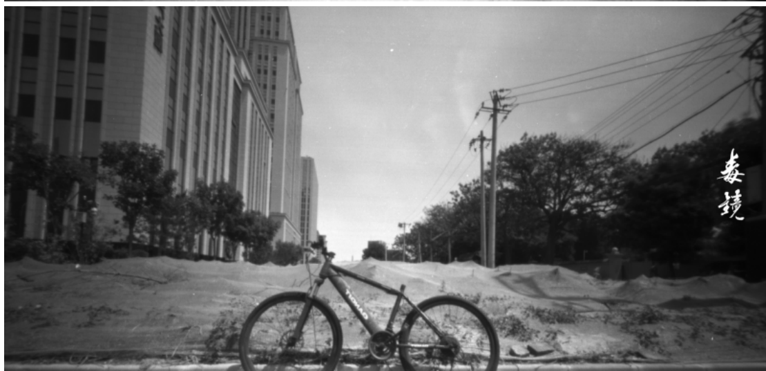
这几张自行车的都没有估算好取景范围